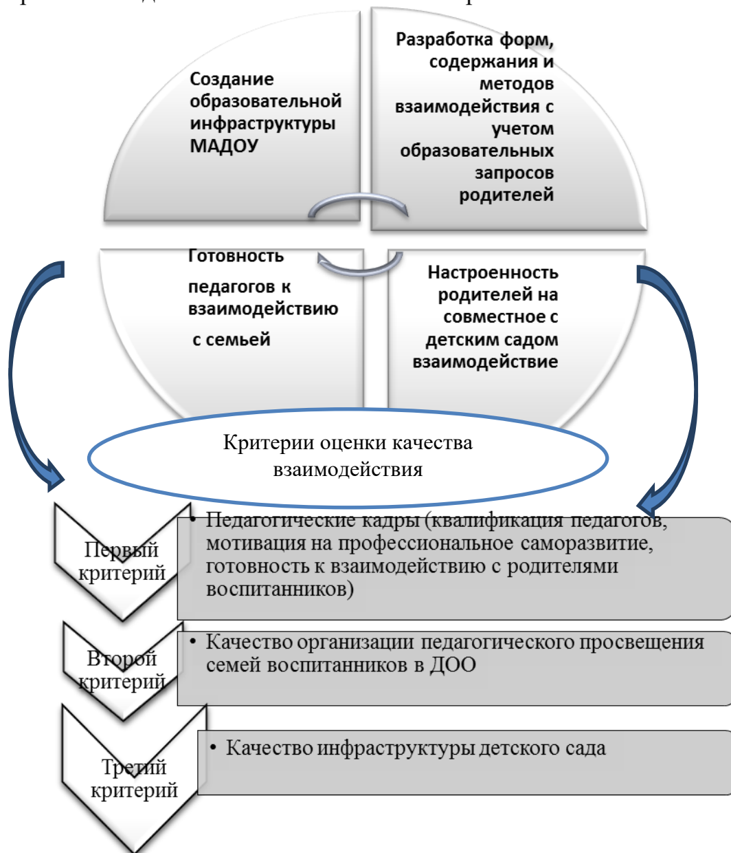
Рис 1. Модель обеспечения качества взаимодействия с семьями воспитанников в МАДОУ № 50

Нами была спроектирована модель обеспечения качества взаимодействия МАДОУ № 50 с семьями воспитанников. Наглядная картина модели представлена на рис 1. Реализация Модели осуществлялась по двум направлениям: работа с педагогическим коллективом и работа с семьей.